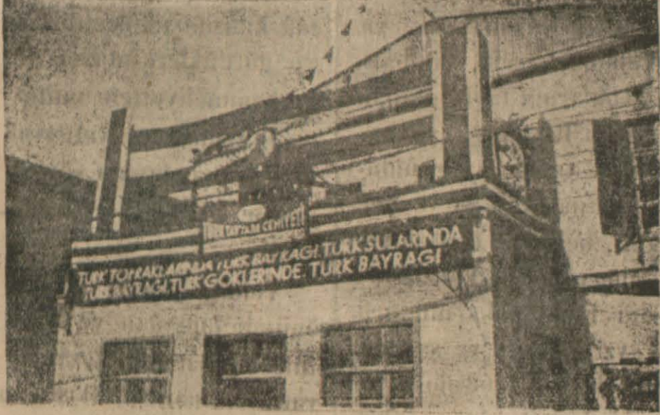
Cumhuriyetin Onuncu Yılı Dönümünde Süslenen Tayyare C. Binası

Hazırlıklar görülüyor. Vekâletler alâkalı olanlara yapılacak işleri tamim ettiler